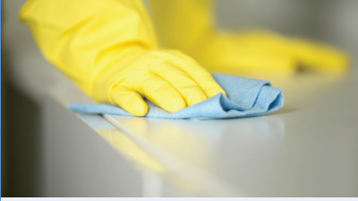
التنظيف بقطعه مبلولة / المسح