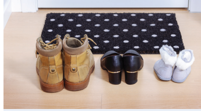
الأحذية خارج البيت