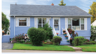
تعرف على بيتك