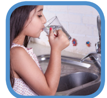
الماء/ انابيب المياه