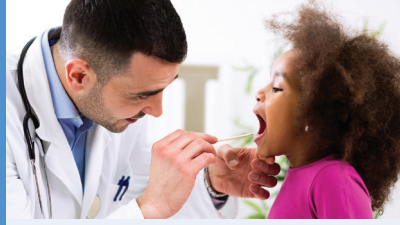
تحدث مع طبيب طفلك